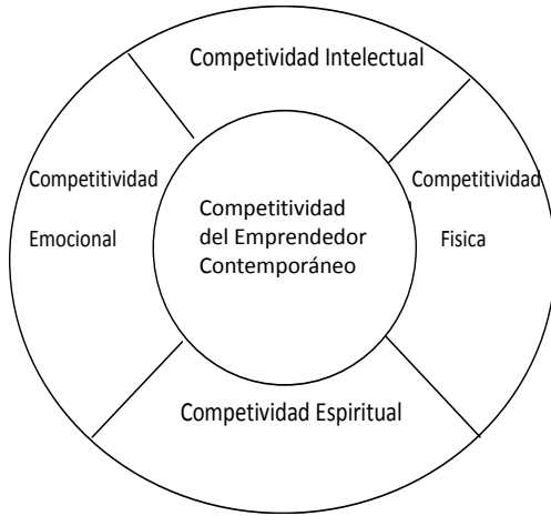
Figura 2. Dimensiones de la competitividad del emprendedor contemporáneo.

del emprendedor lagunero contemporáneo, según el criterio de los autores del presente trabajo. De esta forma, se define la competitividad del emprendedor como el sistema de competencias intelectuales, emocionales, físicas y espirituales que desarrollan su capacidad para responder de manera efectiva a los retos y demandas del entorno globalizado, generando sistemas sustentables, innovadores y con altos niveles de cooperación intra e interempresarial. El logro de este perfil competitivo se sustenta en un sistema multidimensional de competencias (ver Figura 2).